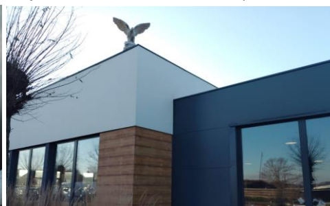
Salon motocyklowy MOTOEAGLES