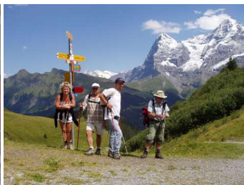
Prawie tak pięknie jak w Tatrach!

Polodowcowa dolina U-kształtna Trümmelbach, Grindelwald, Alpejski Ogród Botaniczny wywarły duże wrażenie.