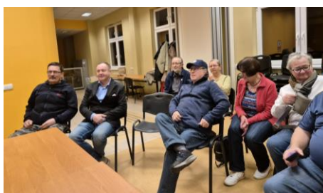
Wśród widzów byli uczestnicy wyprawy

18.08 poniedziałek. Pogoda murowana, więc ruszamy na Jungfrauoch (3571 m). Do Lauterbrunnen wiózł nas nasz autobus, potem kolejka do Kleine Scheidegg (2061m), a następnie wagon kolejki zębatej specjalnie podstawiony dla grupy TRAPER. Na stacji Eismeer 3160 m n.p.m. oglądaliśmy morze lodu. Na Top of Europe Jungfrauoch panowała doskonała pogoda! Zwiedziliśmy pałac lodowy. Spacer po wiecznym śniegu w stronę schroniska Mönschjochhütte 3657m (część najbardziej wytrwałych dotarła do schroniska). Pełni wrażeń wracamy z przełęczy Jungfrauoch. W 1912 r. oddano do użytku kolej przez Kleine Scheidegg do Jungfrauoch. Do dzisiaj jest to najwyższej położona stacja kolejowa w Europie i słynny cel wycieczek. W Kleine Scheidegg odpoczęliśmy i w końcu zjechaliśmy do Lauterbrunnen, skąd nasz autobus zawiózł nas do Interlaken.