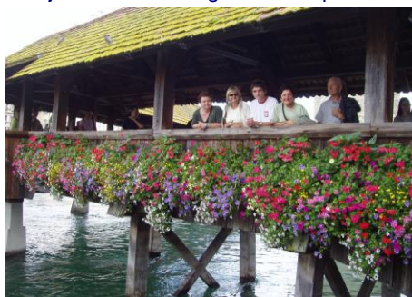
Most w Lucernie

18.08 poniedziałek. Pogoda murowana, więc ruszamy na Jungfrauoch (3571 m). Do Lauterbrunnen wiózł nas nasz autobus, potem kolejka do Kleine Scheidegg (2061m), a następnie wagon kolejki zębatej specjalnie podstawiony dla grupy TRAPER. Na stacji Eismeer 3160 m n.p.m. oglądaliśmy morze lodu. Na Top of Europe Jungfrauoch panowała doskonała pogoda! Zwiedziliśmy pałac lodowy. Spacer po wiecznym śniegu w stronę schroniska Mönschjochhütte 3657m (część najbardziej wytrwałych dotarła do schroniska). Pełni wrażeń wracamy z przełęczy Jungfrauoch. W 1912 r. oddano do użytku kolej przez Kleine Scheidegg do Jungfrauoch. Do dzisiaj jest to najwyższej położona stacja kolejowa w Europie i słynny cel wycieczek. W Kleine Scheidegg odpoczęliśmy i w końcu zjechaliśmy do Lauterbrunnen, skąd nasz autobus zawiózł nas do Interlaken.