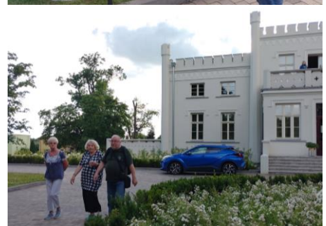
Sprzed pałacu niedaleko do linii 53 MZK Konin