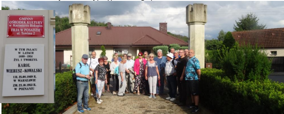
Wejście na teren dworski nawiązuje do neogotyckiego stylu pałacu