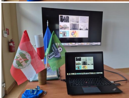
Zebrani z zainteresowaniem obejrzelili zestaw zdjęć i map z końca XX w.