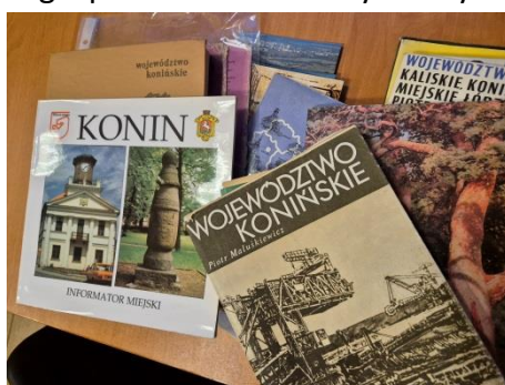
Wystawę książek, informatorów, map i przewodników turystycznych przygotowali członkowie Klubu Turystycznego PTTK w Koninie

Razem w Centrum * 28.04.2025 spotkali się amatorzy wędrowek na spotkaniu towarzysko - dyskusyjnym. Pierwszym punktem programu było przypomnienie utworzenia województwa konińskiego 1 czerwca 1975 r. Przygotowano wystawę wydawnictw z tamtego okresu i omówiono działalność Zarządu Wojewódzkiego PTTK w Koninie. Turystyka konińska rozwijała się wówczas od Uniejowa i Świnic Warckich po Pyzdry. Ciekawe było skonfrontowanie oddania do użytku ośrodka z basenami "na Skarpie" w 1976 r. z obecnymi planami zagospodarowania doliny Warty.