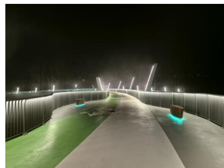
Rowerzyści wracali nową ścieżką rowerową