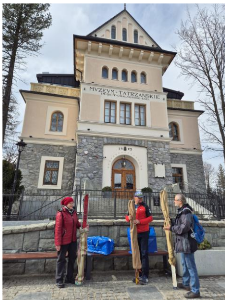
Przed siedzibą Muzeum Tatrzańskiego