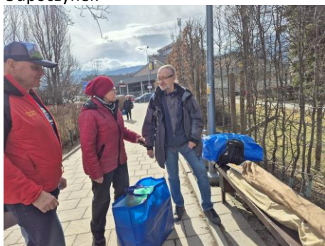
Na parkingu przy ul. 3 Maja w Zakopanem