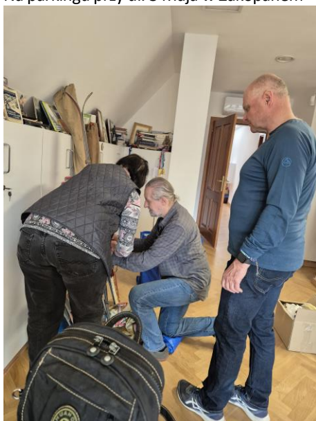
Rozpakowanie na poddaszu