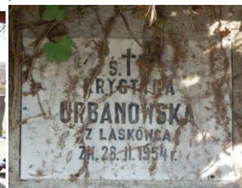
Po folwarku Urbanowskich została kapliczka, park i grobowiec rodzinny w Morzysławiu.

Cała grupa podążyła drogą pieszko-rowerową na cmentarz w Morzysławiu z Andrzejem Łąckim na linii 58,59i60.