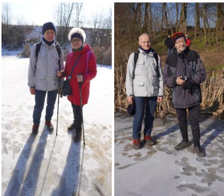
Na zamrzniętym Przeпадłym Dole