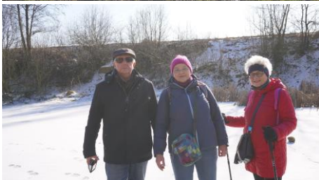
Autorka filmu i zdjęć pośrodku