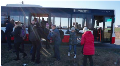
Kierowca linii 51 był zdziwiony, że na przystanku Wola Podłężna I NŻ wysiada tyle osób