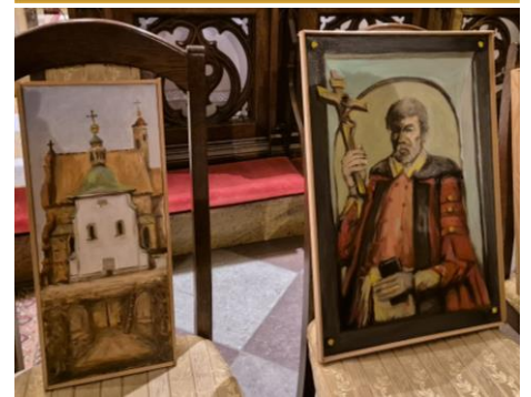
Obrazy Kazimierza Białkowskiego