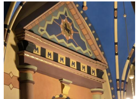
Wejście do kaplicy Zemełki zdobi herb Konina