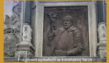
Fragment epitafium w konińskiej farze