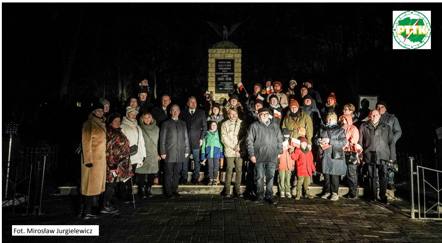
Fot. Mirosław Jurgielewicz