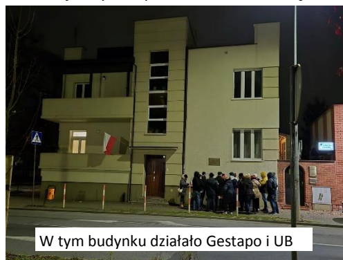
W tym budynku działało Gestapo i UB