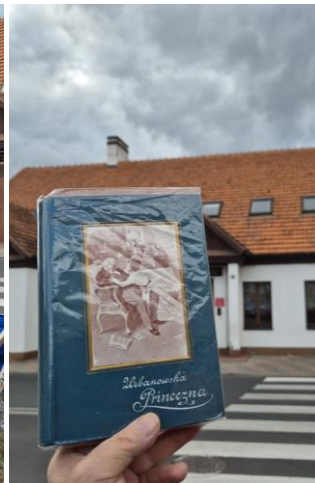
Pod śliwą wiśniową o imieniu ZOFIA, posadzoną w 2019 r., harcerze i zuchy poznawali twórczość Zofii Urbanowskiej z przewodnikiem Wandą Gruszczyńską