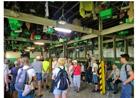
Szatnia tańcuchowa – strefa czysta