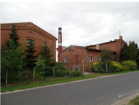
Kryszkowice. Gorzelnia z 1904 r. nadal działa