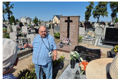
Pomnik poległych pod Nową Wsią. Renowacja w 2023 r.