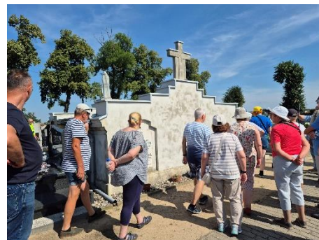
Grób przedsiębiorczych Rozdejczewów z Kryszkowic