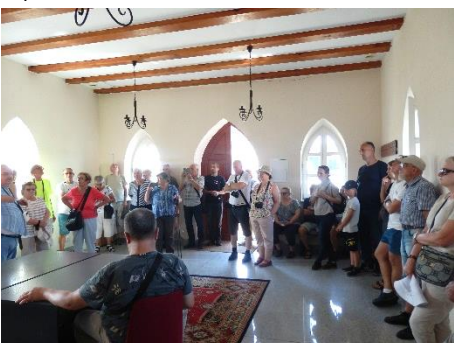
Odnowione wnętrze synagogi w Ziemięcinie