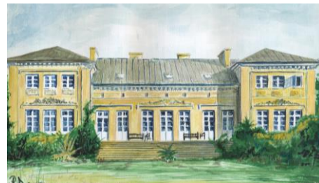
Tak wyglądał pałac Morzyckich w Ruszkowie. Przetrwiał obie wojny w XX w., z resztą majątku został przejęty przez Skarb Państwa. Decyzją gminy (istniała do 1954 r.) Ruszkowo został rozebrany. Rys. Dariusz Radoszewski