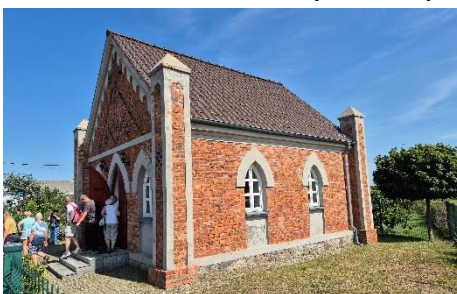
Odnowiona synagoga z XIX w. w Ziemięcinie