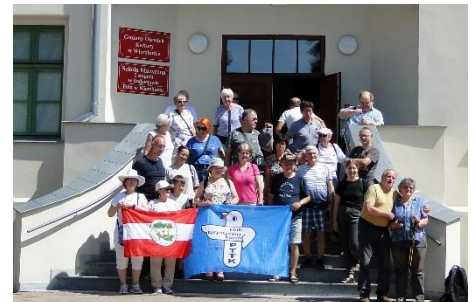
Przed pałacem w Wierzbinku