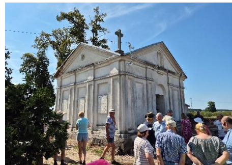
Mauzoleum Morzyckich wyposażono w imienne płyty członków rodu, przygotowane przez ekipę ze Szkoły im. Antoniego Kenara w Zakopanem