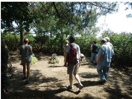
Cmentarz Badaczy Pisma św. w Boguszycach