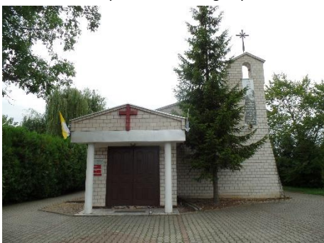
Kościół w Tomisławicach miał zniknąć wraz z wsią