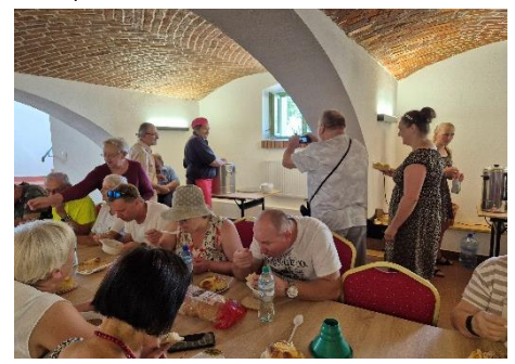
W odnowionych piwnicach pałacowych czekała załoga GOK z kawą, herbatą i lokalną drożdżówką. Grochówka zmieściła się w kosztach wycieczki.