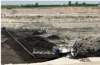
Aktualny widok odkrywki Tomisławice