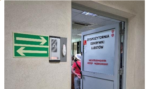
Dyspozytornia – fotografowanie zabronione