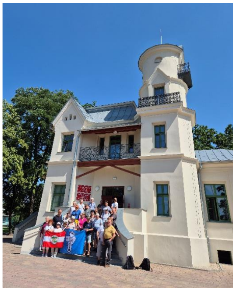
Funkcjonalny zespół pałacowo-parkowy w Wierzbinku spodobał się uczestnikom wycieczki