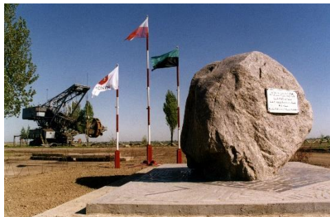
Głaz upamiętniający odkrywkę Pątnów w 2001 r. W 2014 r. tablica była skradziona, a po kilku latach zniknął również głaz