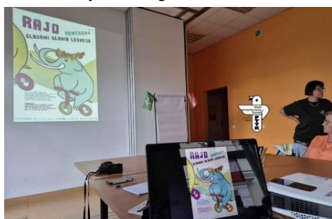
Podczas spotkania omówione zostały zbliżające się wydarzenia w regionie