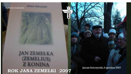
W 2007 r. Oddział PTTK w Koninie włączył się w obchody Roku Zemełki w 400. rocznicę śmierci doktora