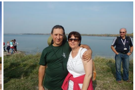
W 2014 r. brzegi zbiornika nie były tak porośnięte, jak obecnie