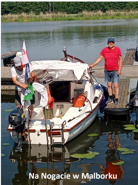
Na Nogacie w Malborku