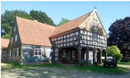
Gospoda Mały Holender