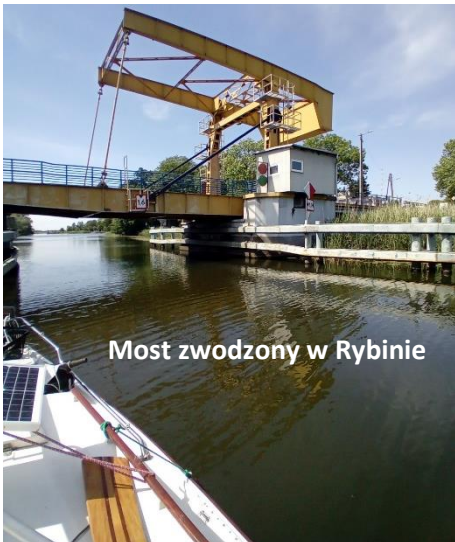
Most zwodzony w Rybinie