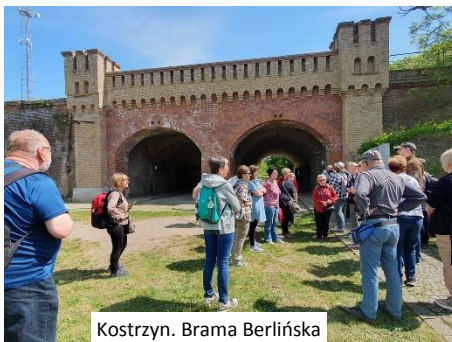
Kostrzyn. Brama Berlińska