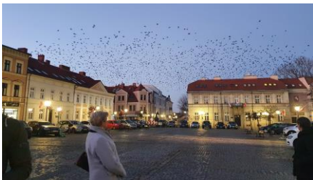
Na placu Wolności witały ptaki