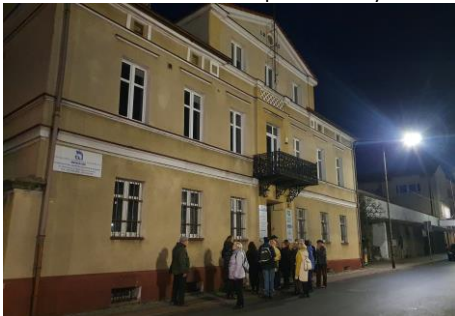
Budynek dawnego urzędu skarbowego, zwany potocznie Kasą Powiatową, przy ówczesnej ulicy Browarnej (później Pivnej), teraz Z. Urbanowskiej