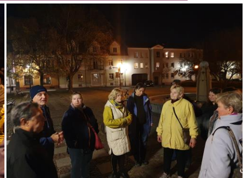
Zakończenie przechadzki na placu Zamkowym.