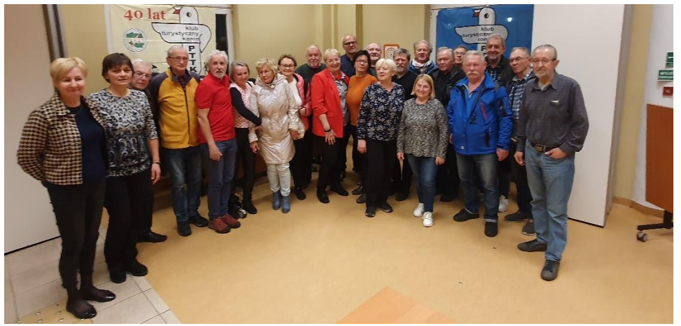
XXI kadencja Klubu Turystycznego PTTK w Koninie rozpoczęta

Tekst WG