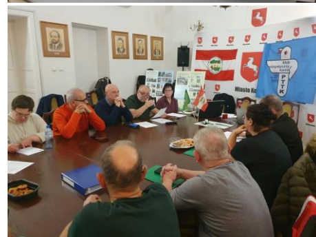
Kolejne walne 22 kwietnia 2024 r. opisała Wanda Gruszczyńska