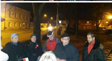
Wojska wykorzystywały budynki przy ul. Kolskiej