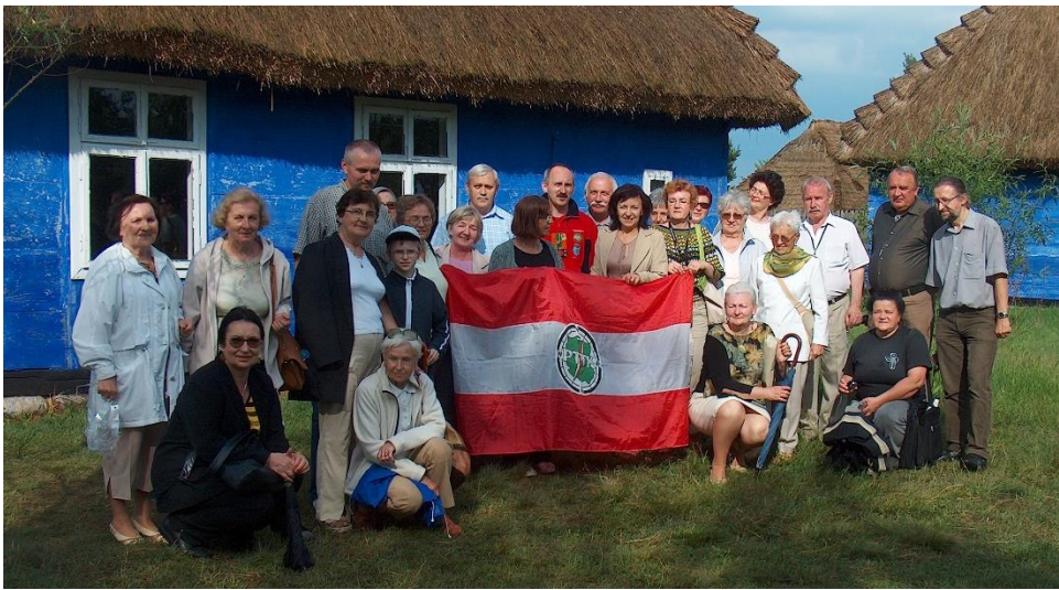
11 czerwca 2009 r. Grupa PTTK Konin w skansenie Ziemi Łowickiej w Maurzycach