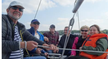
Motorówka SZUWAR na prawie pierwszym rejsie – sprawdzanie możliwości!