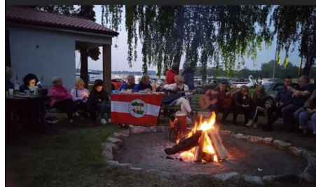
Gramy to co w duszy gra! „Przechyli”, „Kiedy rum”...