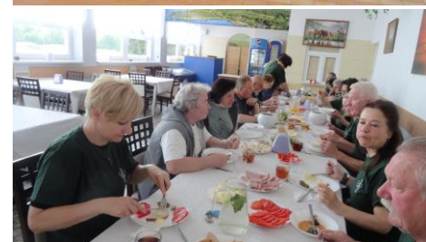
Integracyjne posiłki w bufecie plażowym