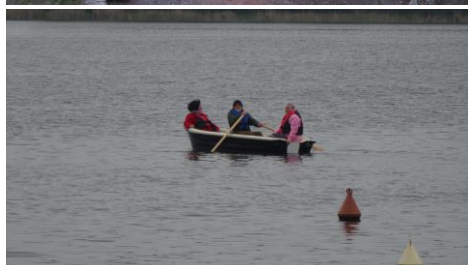
Miło w wiosennej porze pływać łódką po jeziorze