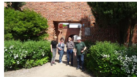
A któż mógł zaprosić wszystkich chętnych do Muzeum Okręgowego w Koninie? Oczywiście, Prezes Marek! A przewodnikiem była Majka, częsta bywalczyni!