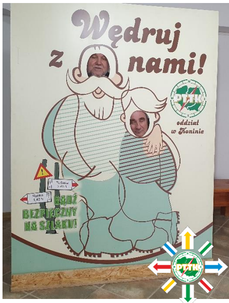
Organizację wsparło Miasto Konin www.pttk.pl WĘDRUJ Z NAM!