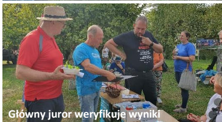
Główny juror weryfikuje wyniki