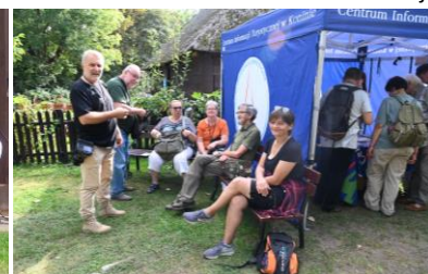
Przed namiotem CIT