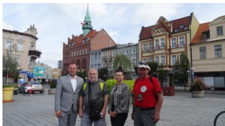
Władze Wrześni powitały wycieczkę w Koninie