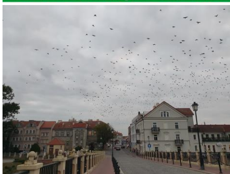
Na straży dojazdu do placu Wolności fruwają wrony i kawki