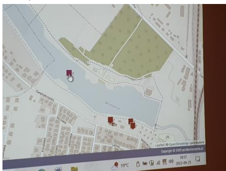
Zabytki Wrześni na portalu Niezwykła Polska