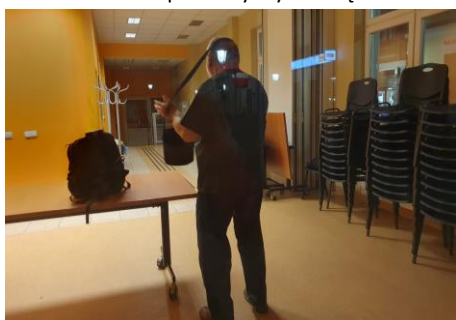
Ostatnie spojrzenie na salę i pakowanie toreb