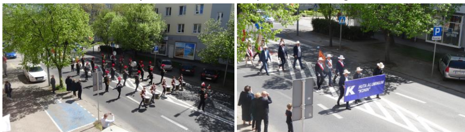
O godzinie 12.00 w Morzysławiu rozpoczął się przemarsz górniczych orkiestr dętych z Konina, Bełchatowa, Turowa, kopalni soli z Kłodawy i Inowrocławia. Uczestnicy przemarszu zatrzymali się przy głazie narzutowym, który stanął w Morzysławiu w 1995 r., w 50. rocznicę powstania kopalni.

Tego dnia odbywały ostatnio pochody pierwszomajowe, w których brały zazwyczaj środowiska lewicowe. W tym roku organizatorzy przystali na propozycję Stowarzyszenia Tradycji Zakładu Badawczo-Rozwojowego POLMOS Konin. Inicjatywę wsparły stowarzyszenia górnicze, „Przegląd Koniński”, instytucje, a swoim patronatem honorowym objęli Prezydent Miasta Konina oraz Starosta Koniński, a także wójtowie i burmistrzowie z powiatu konińskiego.