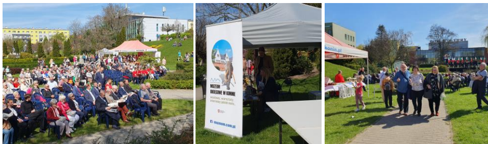
My wśród publiczności