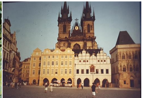
Praga czeska, wycieczka oddziałowa w 1993 roku