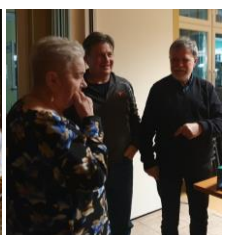
Pożegnania po zapaleniu świateł. To my wszyscy jesteśmy z bloków?