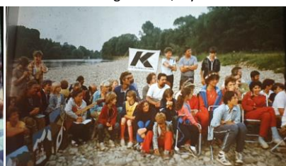
XX Zjazd Pracowników Przemysłu Metali Nieżelaznych w Beskidzie Makowskim - baza w Myślenicach-Zarabiu 1987 r.