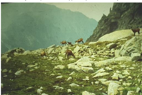
Jedna z pasji Andrzeja: fotografowanie przyrody podczas wędrowek górskich