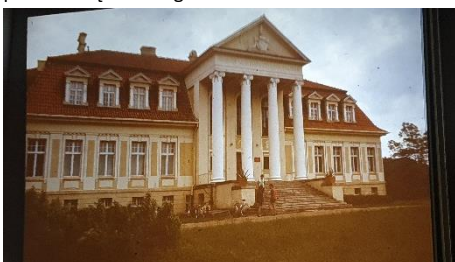
Pałac w Winnej Górze podczas rajdu Chatkowego Oprac. WG