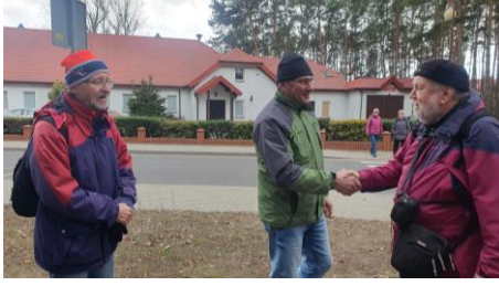
Powitanie dwóch Marków (i dwóch prezesów)