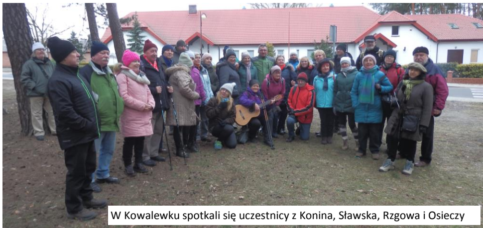
W Kowalewku spotkali się uczestnicy z Konina, Sławska, Rzgowa i Osieczy