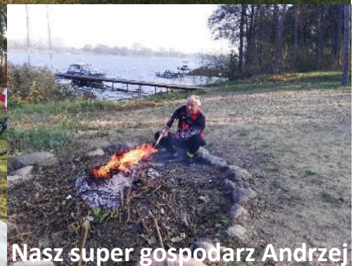
Wspólne biesiadowanie nad Jeziorem Mikorzynskim