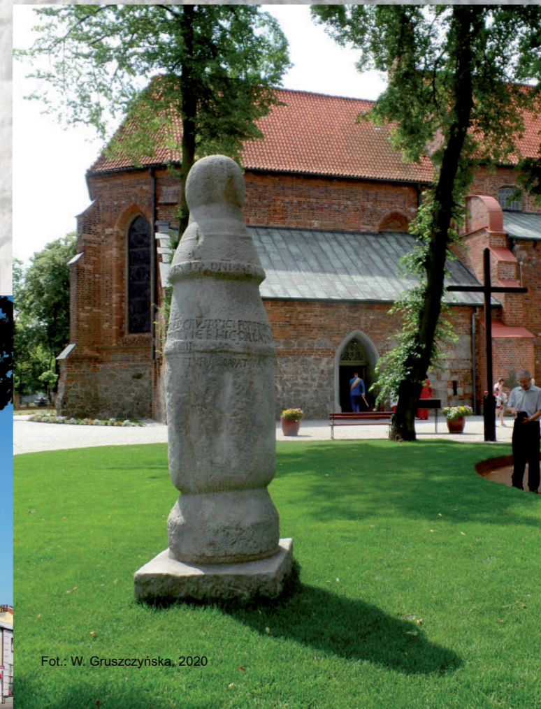
Fot.: W. Gruszczyńska, 2020

SŁUP KONIŃSKI (określenia równoznaczne: Słup drogowy w Koninie lub Koniński słup drogowy; niepoprawnie: słup milowy) to kamienny słup (piaskowiec, prawdopodobnie pochodzenia lokalnego, z Brzeźna; wysokość ok. 2,5 m) stojący na dawnym piastowskim, państwowym i handlowym szlaku. Inskrypcja na słupie od 1151 roku informuje m.in. o postawieniu go w połowie drogi z Kruszwicy do Kalisza oraz poświadcza, że dokonał tego (poleciał) Petrus comes palatinus . Dzięki badaniom historycznym prof. Janusza Bieniaka, od roku 1982 mamy pewność, że był to wojewoda Piotr Włostowic.