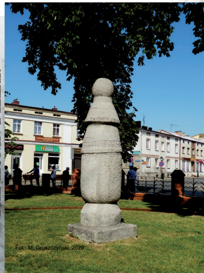
Fot.: M. Gruszczyński, 2020

Autorzy: Wanda i Michał Gruszczyńscy, Konin 2020