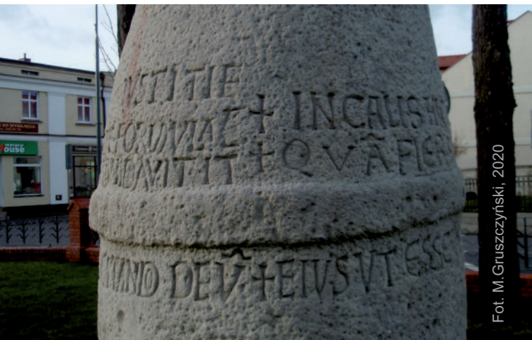
Fot. M. Gruszczyński, 2020

Inskrypcja powstała w 1151 r. (MCL PRIMO) na zamówienie Piotra Włostowica i jest jedną z kilku pozostawionych przez jego ród. Jest ważnym zabytkiem polskiej średniowiecznej literatury (poezji) i epigrafiki, a ponadto jest najstarszą datowaną wykutą w kamieniu oraz najdłuższą wczesnośredniowieczną inskrypcją w Polsce.