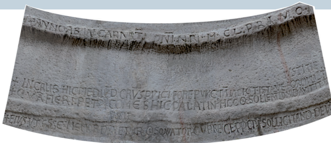
Fotograficzne rozwinięcie inskrypcji na płaszczyznę - fot. Tomasz Płóciennik, oprac. Dobrochna Zielińska, 2016

+ ANNO AB INCARNAT(ione) D(omi)NI N(ost)RI M CL PRIMO + IN CALIS HIC MEDIV(m) DE CRV(m)n)SPVICI FORE PVNCTV(m) INDICAT ISTA VIE FORMVLA IVSTITIE + QVA(m) FIERI PETR(us) IVSSIT COMES HIC PALATIN(us) HOC Q(u)I SOLLERT(er) DIMIDIAVIT IT(er) + EIVS VT ESSE MEMOR DIGNETVR O(mn)ISQ(ue) VIATOR CV(m) PRECE P(ro)PICIV(m) SOLLICITANDO DEV(m)