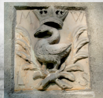
Godło Łabędź nawiązujące do herbu potomków Piotra Włostowica, na ścianie kościoła pw. św. Szczepana w Skrzynnie (woj. mazowieckie)