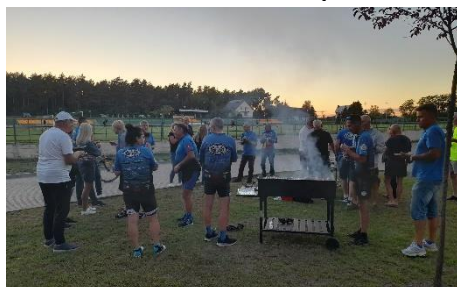
Powitalny grill w świetle zachodzącego słońca