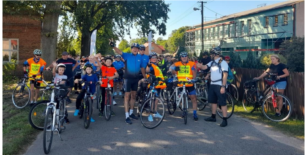
Łączymy grupy rowerowe w Kiszewach