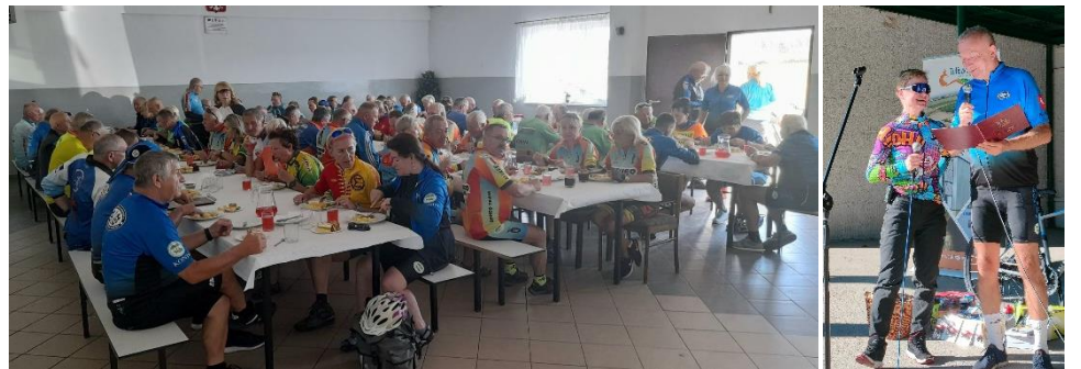
Poczęstunek w Wielopolu