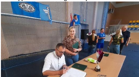
Wpis do kroniki składa prezes OSP Wielopole, obok przewodnicząca KGW Wielopole