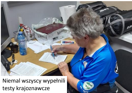
Niemal wszyscy wypełnili testy krajoznawcze