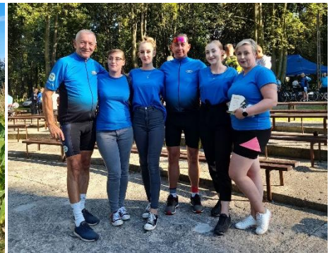
Koleżanki z Wielopola też w niebieskich koszulkach