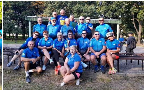
Elita STR CIKLO Klubu Turystycznego PTTK w Koninie z pucharem Burmistrza na podsumowaniu w parku