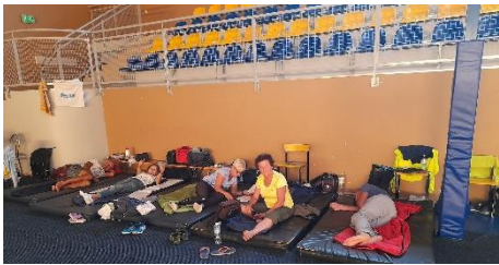
Materacy starczyło dla wszystkich