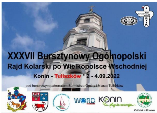
Projekty emblematów rajdowych przygotowała Wanda Gruszczyńska