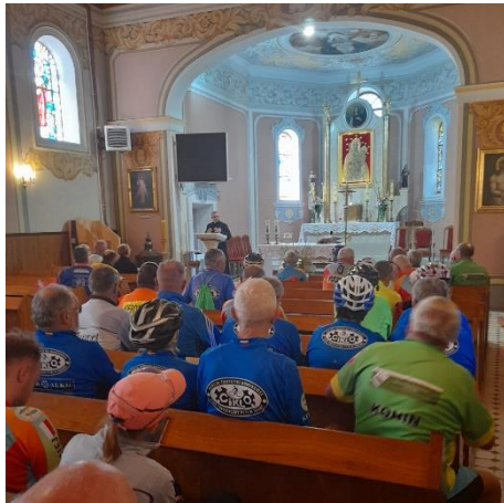
Parafia w Grzymiszewie ma burzliwą historię