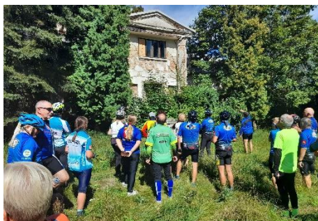
Pozostałości dworu w Smaszewie