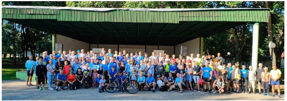
Finał wakacyjnych rajdów rowerowych w gminie Tuliszzków