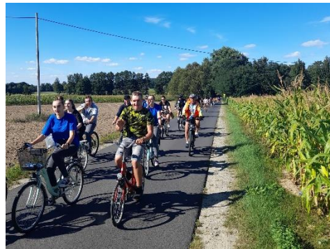
Korowód rowerzystów był imponujący