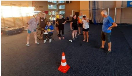
Konkurs sprawnościowy WORD – co widać?