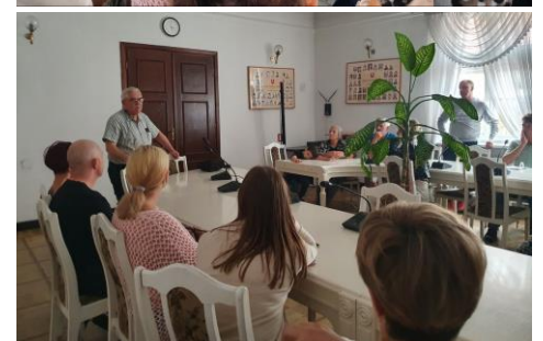
Synagogę i ratusz udostępnił pracownicy Urzędu Miejskiego, za co dziękujemy. WG