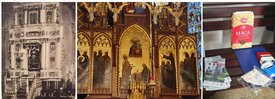
Tak wyglądał aron-ha-kodesz

Znaleźli się chętni do rozegrania Gry Rodzinnej św. Bartłomieja. Wędrując między zabytkowymi budynkami, które zostały przez Urząd Miejski opatrzone tablicami informacyjnymi, rozwiązywali test. Po drodze wstąpili do specjalnie otwartej synagogi, gdzie mogli zajrzeć do wnętrza, uzyskać odcisk pieczęci i skosztować koszernej macy. Upominki dla uczestników gry przygotowała Lokalna Organizacja Turystyczna Marina. Rozwiązaniem testu był urywek z V księgi "Pana Tadeusza", jako że obchodzimy Rok Romantyzmu Polskiego. Zaś mistrz Adam Mickiewicz zacerpnął wątki do swego dzieła z podróży po Wielkopolsce.