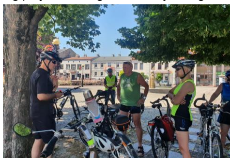
Rozpoczęcie rajdu przez komandora