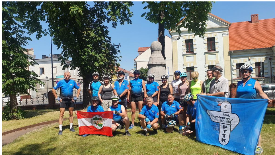
Silna grupa STR KT PTTK CIKLO wyruszyła spod Słupa Konińskiego