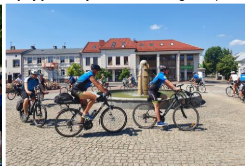
Runda honorowa wokół stylizowanej fontanny

Po krótkim przypomnieniu znaczenia Słupa Konińskiego, dzięki któremu Konin znalazł się na Szlaku Piastowskim, cykliści pomknęli w upale, myśląc o fundatorze Słupa. Ciekawym wydarzeniem na trasie rajdu było spotkanie z rowerzystami z Rychwała i z grupą rowerową z Kalisza, którzy również spędzili w ten sposób wspólnie czas podczas Weekendu na Szlaku Piastowskim. Nie zabrakło dla wszystkich poczęstunku w gminie Rychwał. Przy wyjątkowo gorącej aurze rowerzyści pokonali łącznie 75 km, niektórzy jeszcze więcej. Był to na pewno aktywnie i ciekawie spędzony czas na początek gorącego lata.