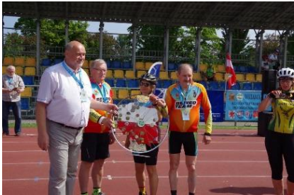
Złotowe koło przechodnie

Podczas zlotu został zorganizowany kurs na Przodownika Turystyki Kolarskiej PTTK. Na zlot zgłosiły się 592 osoby, z których część skorzystała ze specjalnego wagonu do przewozu rowerów w relacji PKP IC Kraków Gł. – Kołobrzeg i odwrotnie. Była też grupa z Ukrainy. Przez tydzień miłośnicy jednośladów codziennie pokonywali kolejne kilometry ścieżek i tras rowerowych w regionie.