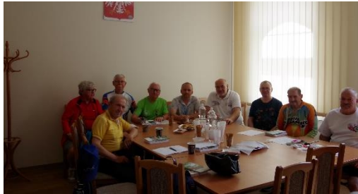
Podczas zlotu odbyło się posiedzenie Komisji Turystyki Kolarskiej ZG PTTK.