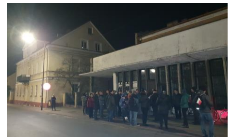
Dawny Urząd Skarbowy (zwany potocznie Kasą Powiatową) i kinoteatr Polonia.

Komendant POW Dyc w sali kina „Polonia” zwołał wiec peowiaków i obywateli Konina. Wybrana na wiecu Komisja Obywatelska udała się do siedziby władz powiatowych przy rynku (Plac Wolności). Znajdowali się tam niemieccy urzędnicy zarządzający cywilnego. Dyc zażądał wydania znajdujących się tutaj w skrzyniach karabinów.