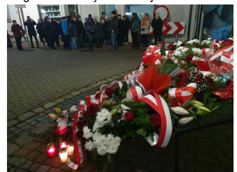
„Pogrzeb ofiar gwałtu Prusaków” odbył się w środę 13 listopada 1918 r.