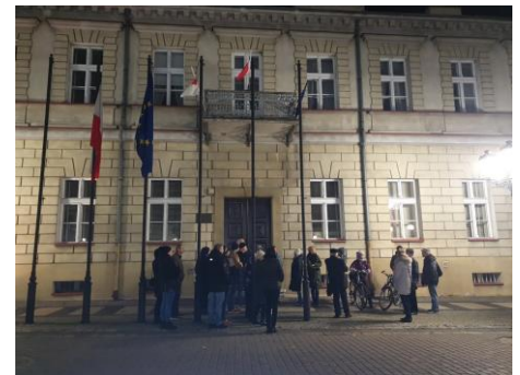
Po przejęciu broni oddział POW przeszedł do gmachu szkoły handlowej.

Komendant POW Dyc w sali kina „Polonia” zwołał wiec peowiaków i obywateli Konina. Wybrana na wiecu Komisja Obywatelska udała się do siedziby władz powiatowych przy rynku (Plac Wolności). Znajdowali się tam niemieccy urzędnicy zarządzający cywilnego. Dyc zażądał wydania znajdujących się tutaj w skrzyniach karabinów.