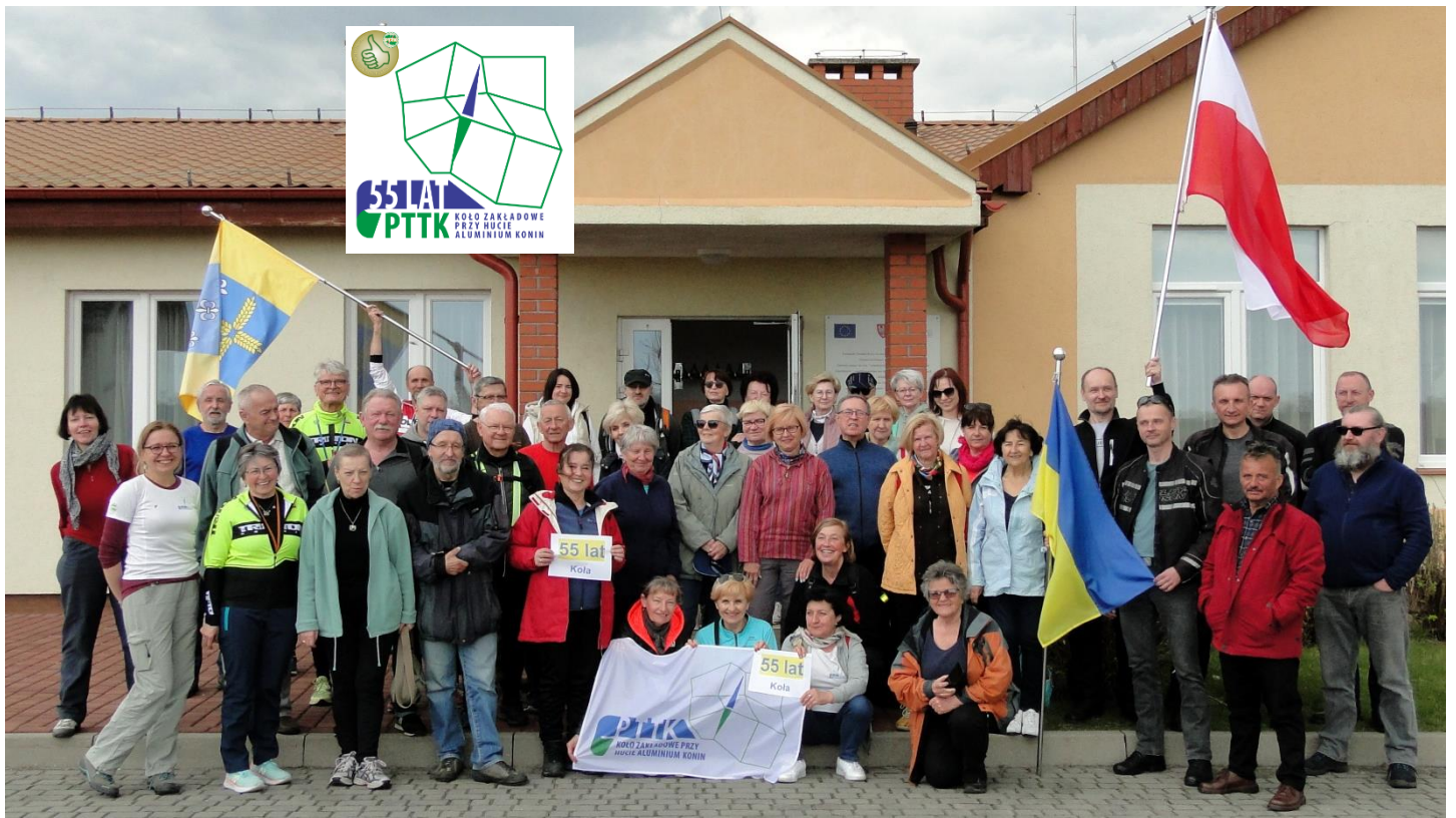
W „Rajdzie Wiosennym ‘2022” Koła Zakładowego przy Hucie Aluminium Konin do świetlicy w Ostrowitem uczestniczyły 63 osoby