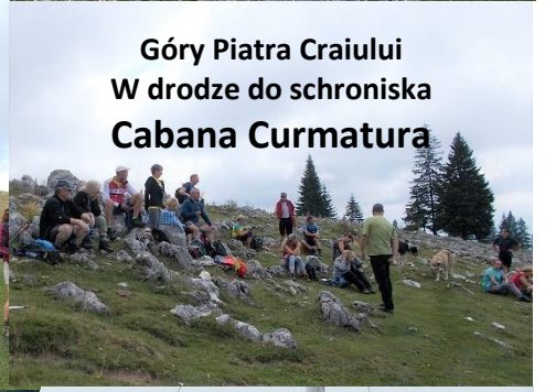
Góry Pietra Craiului W drodze do schroniska Cabana Curmatura