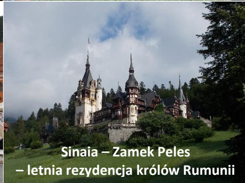
Sinaia – Zamek Peles – letnia rezydencja królów Rumunii