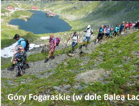
Góry Fogaraskie (w dole Balea Lac)