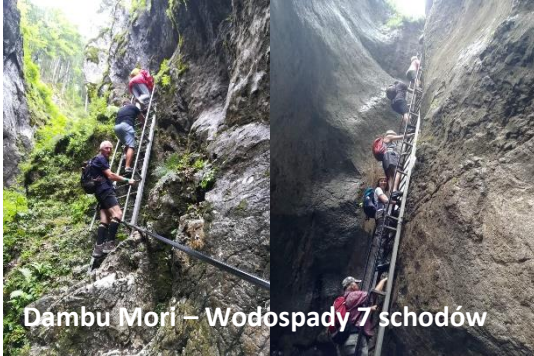
Dambu Mori – Wodospady 7 schodów