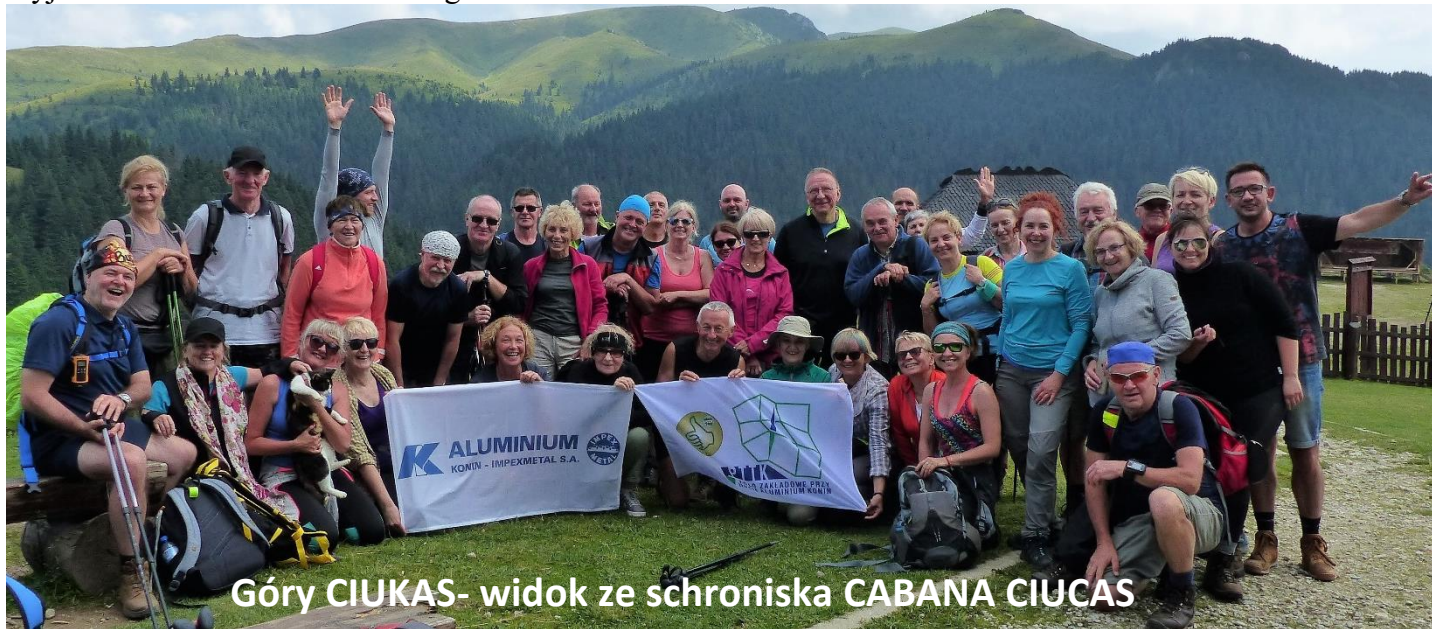
Góry CIUKAS- widok ze schroniska CABANA CIUCAS