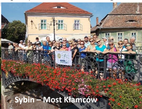
Sybin – Most Kłamców

- cerkiew koronacyjna rumuńskich władców