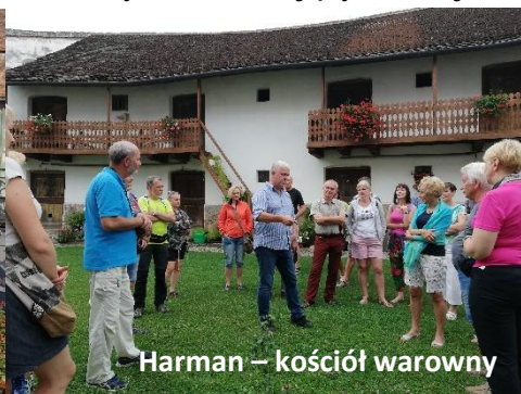
Harman – kościół warowny