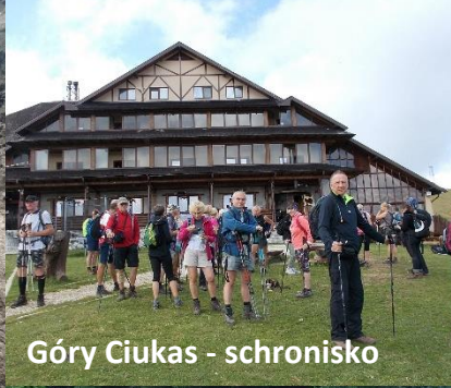
Góry Ciucas - schronisko