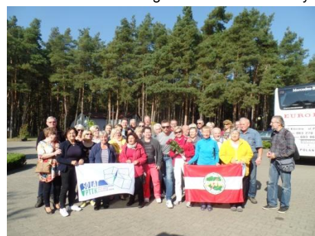
Pożegnanie z WIELSPINEM