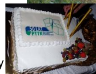
Królewski tort na 50 lat