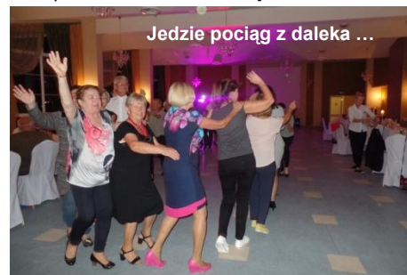
Jedźcie pociąg z daleka ...