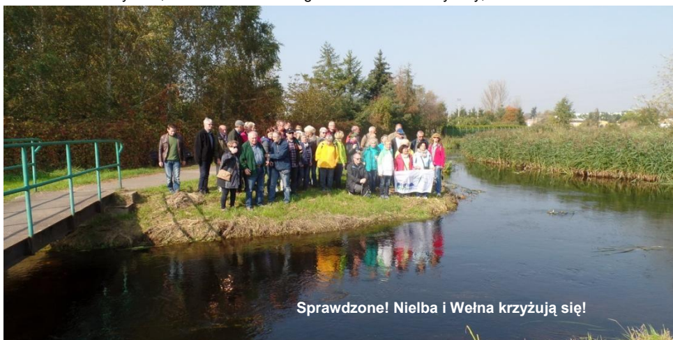
Sprawdzone! Nielba i Wełna krzyżują się!

Tekst: W. Gruszczyńska, I. Smucerowicz