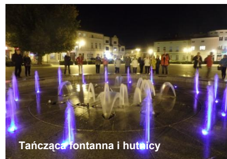
Tańcząca fontanna i hutnicy