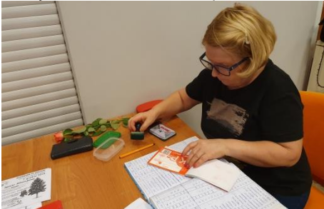
Koleżanka skarbnik miała sporo pracy