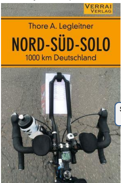
Thore, wir laden in Konin ein!