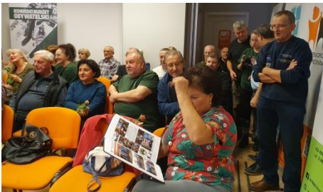
W kronikach są udokumentowane dokonania