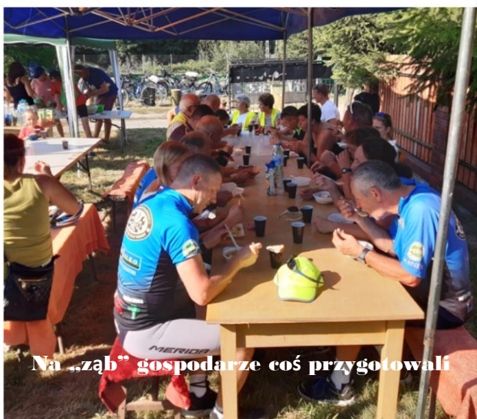
Na „zab” gospodarze coś przygotowali