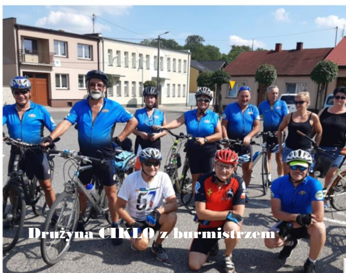
Drużyna CYKLO z burmistrzem