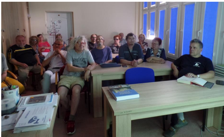
W pracowni Centrum Edukacji Cyfrowej im. Jana Zemełki