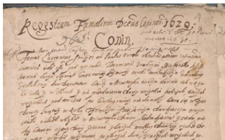
O zamku w Koninie w 1629 roku

Wydawnictwo przygotowane i wydane przez Archiwum Państwowe w Poznaniu, we współpracy z Miejską Biblioteką Publiczną w Koninie Zespół autorsko-redakcyjny płyty Źródła do dziejów zamków wielkopolskich do schyłku XVIII w. w zbiorach Archiwum Państwowego w Poznaniu: Jerzy Łojko, Tomasz Balcerek, Przemysław Wojciechowski, Mariusz Jankowski