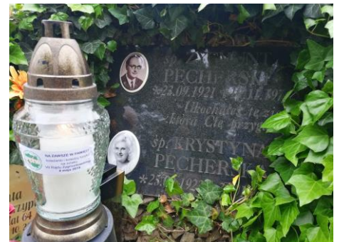
Zygmunt Pęcherski zmarł w 1974 roku