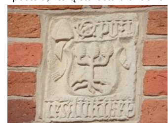
Herb Godziemba fundatora klasztoru bernardynów bpa Jana Lubrańskiego w Kazimierzu Biskupim