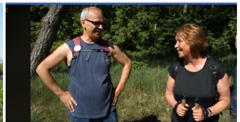
VI Rajd Zygmunowski PTTK (część muzyczna) Klub Turystyczny PTTK Oddział Konin