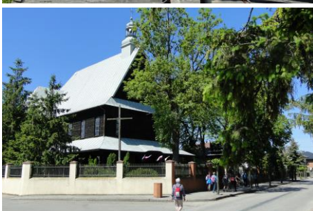
Największy w Wielkopolsce kościół drewniany