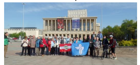
Przed Teatrem Wielkim w Łodzi

Gruszczyńscy wykorzystali rowery do wieczornych przejażdżek i eksploracji Łasku Łagiewnickiego.