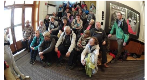
Słynne schody w Szkole Filmowej