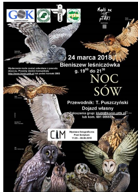
Zapraszamy na wystawę fotograficzną do CIM w dniach 11 maja do 8 czerwca 2018 r.