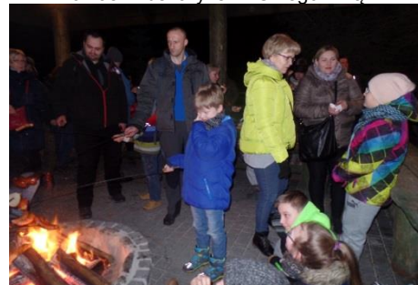
Ognisko przygotowane przez leśniczych