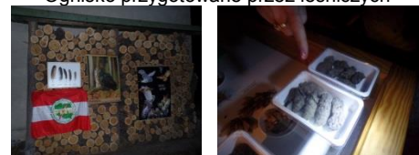
Pióra i wypluwki sów