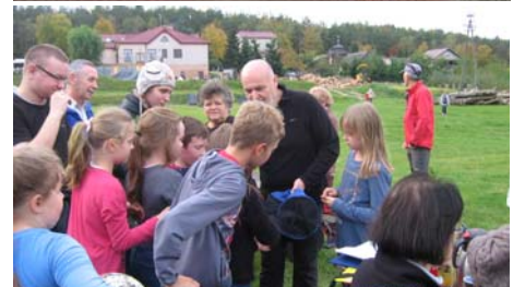
Miejskie upominki otrzymali: SP Sławsk, Radowid, Pelinki, Silna Grupa Kijkowa, Kubeczki, Jola i przyjaciele.