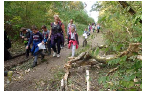
Ślady niedawnych wicher