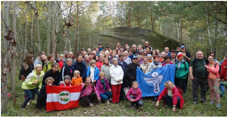
Trasę pieszą 5 km z Anielewa przez cmentarz ewangelicki Izabelin do Gościńca przebyło 110 osób.