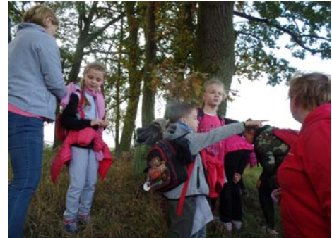
Spacerowa zgadywanka urozmaiciła spacer