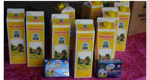
Smaczne produkty OSM MONA pasowały do ziemniaków