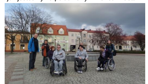
O placu zamkowym można wiele powiedzieć