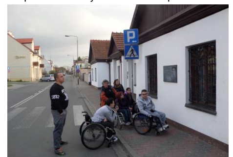
Jeśli czytać Urbanowską – to tylko w Koninie!