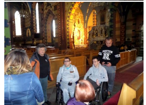
Podwoje konińskiej fary stały otworem