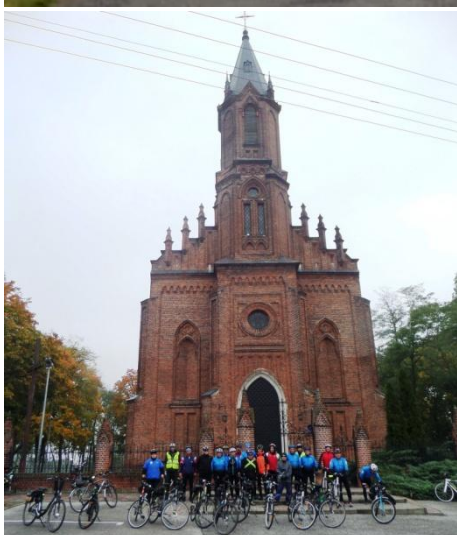
Przed kościołem w Krzymowie.