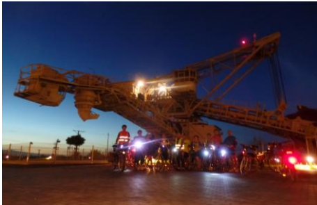
Nocny spacer po Kleczewie