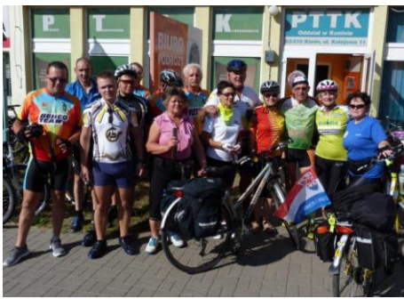
Start w Koninie