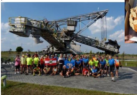
65 cyklistów w Kleczewie