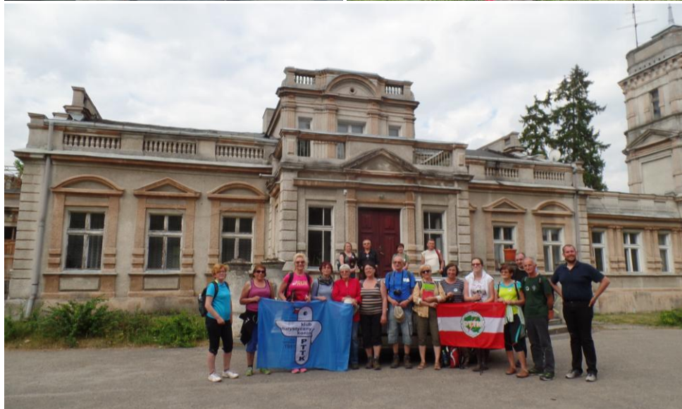
Uczestnicy rajdu w gościnnej Stadninie Koni w Mieczownicy.

Trasa rajdu: Słupca - Koszutki - Młodojewo - Korwin - Brzozogaj - Mieczownica - Kąpiel 28 km