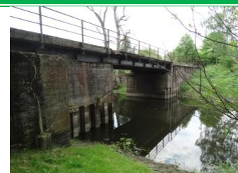
Forteczny most zwodzony obrotowy w Bledzewie