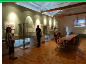
Muzeum Grodu Santok im. Jana Dekerta