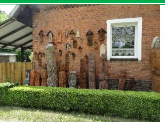
Stary Dworek - dzieła miejscowego rzeźbiarza