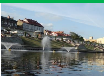
Przepiękny widok na Gorzów Wlkp.