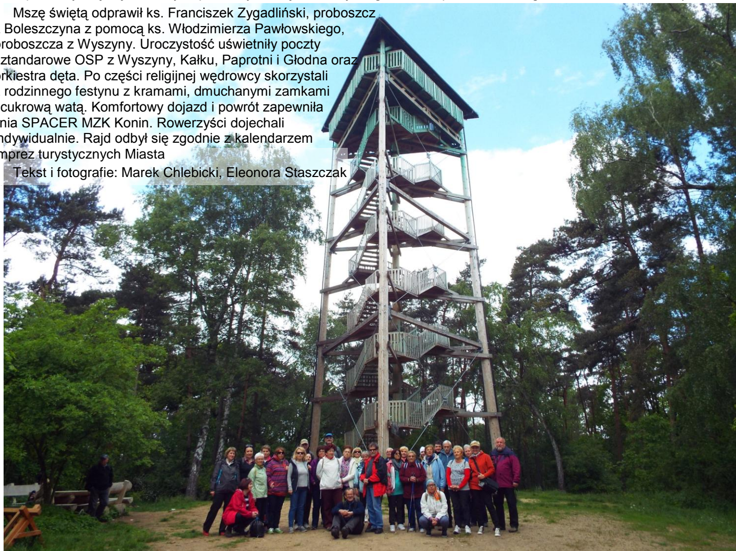
Pamiątkowe zdjęcie 33 piechurów na Złotej Górze 191 m n.p.m.

Tekst i fotografie: Marek Chlebicki, Eleonora Staszczak